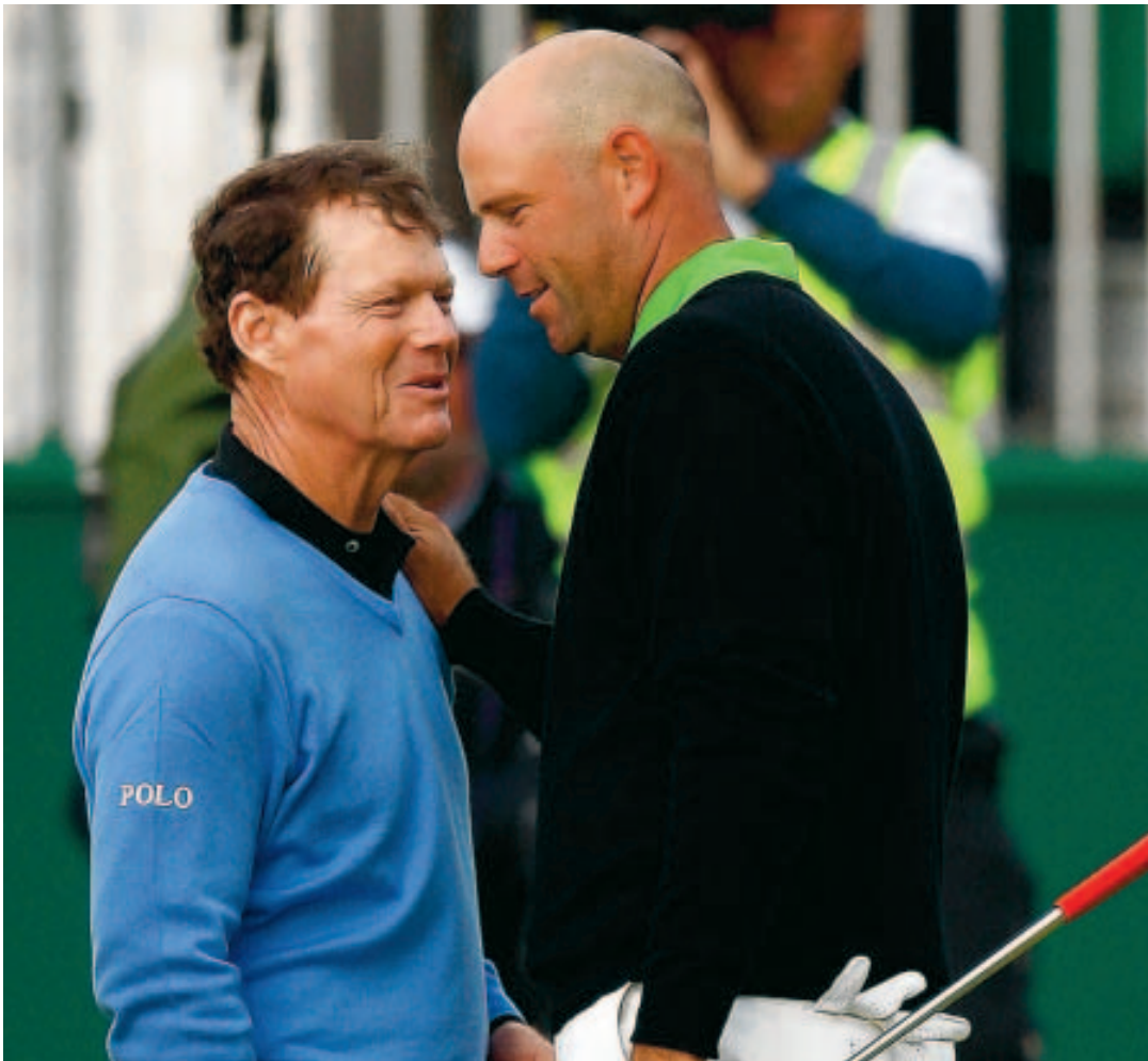
TOM WATSON (à gauche) et Stewart Cink témoignent d'un grand respect réciproque.

L'Américain Stewart Cink (36 ans) a remporté dimanche à Turnberry l'Open de Grande-Bretagne, troisième levée du Grand Chelem, en battant son compatriote, le vétéran Tom Watson (59 ans) après un barrage de quatre trous.